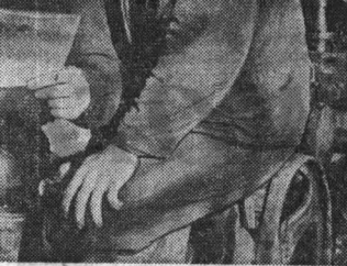
Рабочие мастерской Топчихинского объединения «Сельхозтехника» проявляют живой интерес к материалу Пленума ЦК КПСС.

Большой деловой разговор состоялся на открытом партийном собрании треста «Алтайэлеваторстрой». Коммунисты и беспартийные обсуждали вопрос об оказании помощи совхозу «Большевик» Тальменского производственного управления.