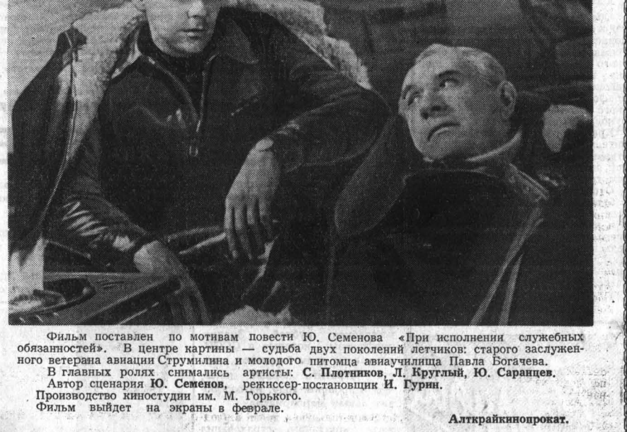
Фильм поставлен по мотивам повести Ю. Семенова «При исполнении служебных обязанностей». В центре картины — судьба двух поколений летчиков: старого заслуженного ветерана авиации Струмилина и молодого питомца авиационной школы Павла Богачева.

НЬЮ-ЙОРК, 4 февраля. (ТАСС). Морское министерство США объявило сегодня о запуске искусственного спутника Земли для сбора информации о процессах, происходящих на Солнце.