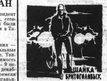
На экраны кинотеатров края вышедший немецкий (ГДР) художественный фильм «Шанка Бритоголовых».

КРАСНЫЙ ТЕАТР ДРАМЫ. ОДИН ГОД. «Кино» Кинотеатр «РОССИЯ». ЧЕЛОВЕК, КОТОРЫЙ СОНМЕВАЕТСЯ. В 10, 11, 11.45, 12.45, 1.30, 2.30, 3.15, 4.15, 5, 6, 6.45, 7.45, 8.30, 9.30, 10.15. Кинотеатр «РОДИНА». ЧЕЛОВЕК, КОТОРЫЙ СОНМЕВАЕТСЯ. В 10, 11, 11.45, 12.45, 1.30, 2.30, 3.15, 4.15, 5, 6, 6.45, 7.45, 8.30, 9.30, 10.15. На удлиненном сеансе в 9.30. 1. МАТЧ ГИГАНТОВ. 2. КОТЛА ЗАБИВАЕТ ЗИМА. Кинотеатр «ОКТАВЬЯ». ШАНКА БРИТОГОЛОВЫХ. В 10, 11.45, 1.30, 3.15, 5, 6, 6.45, 7.45, 8.30, 9.30, 10.15. Кинотеатр «ПЕРВОМАЙСКИЙ». ШАНКА БРИТОГОЛОВЫХ. В 10, 11.45, 1.30, 2.10, 3, 3.15, 4.15, 5, 6, 6.45, 7.45, 8.30, 9.30, 10.15. Кинотеатр «АКЦИЯ». АДЕРА В КАЗИНО. В 3, 5, 7, 9. Клуб ЗАПАДНОГО ПОСЕЛКА. ЧЕЛОВЕК, КОТОРЫЙ СОНМЕВАЕТСЯ. В 3, 5, 7, 9.