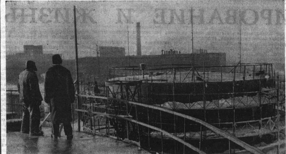
На строительстве завода полуактивной сажки Барнаульского резино-асбестового комбината.