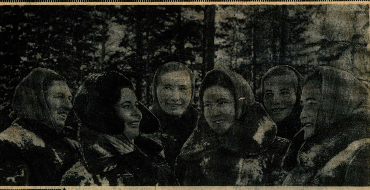
ТАК ЖИВЕТ И ТРУДИТСЯ НАШЕ СЕЛО

МОСКВА, 25 января. (Корр. ТАСС). Состоялся пленум правления общества «Знание» РСФСР. Председателем правления избран академик И. И. Аргобьевский.