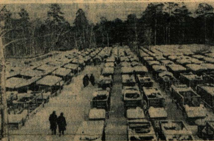
ИДЕТ ОБЩЕСТВЕННЫЙ СМОТР ЗИМОВКИ СКОТА

Но люди совхоза «Лесной» умеют не только отлично трудиться. Они много учатся, хорошо организуют свой отдых. Об этом рассказывается на следующих страницах.