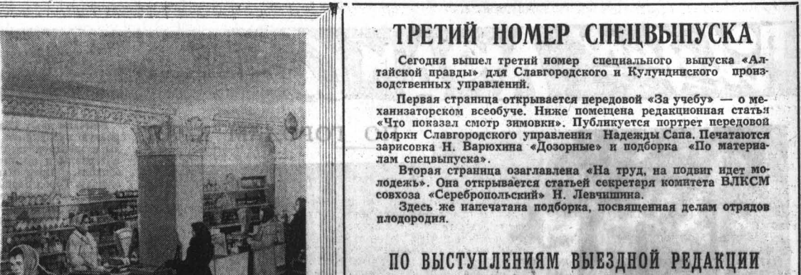
Фото и текст В. НИКОЛАЕВА. Бийское управление.

Так трудятся и отдыхают в совхозе «Лесной». Рабочие уверены в своем будущем, потому что свое счастье они строят сами.