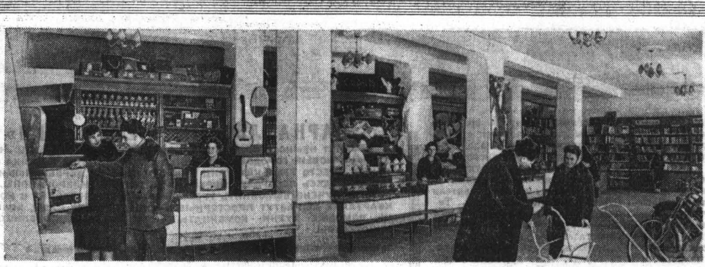
ТАК ЖИВЕТ И ТРУДИТСЯ НАШЕ СЕЛО