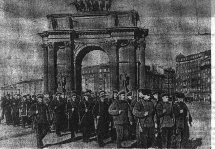
Ленинград в дни блокады. Рабочие Кировского завода идут на фронт защищать родной город.