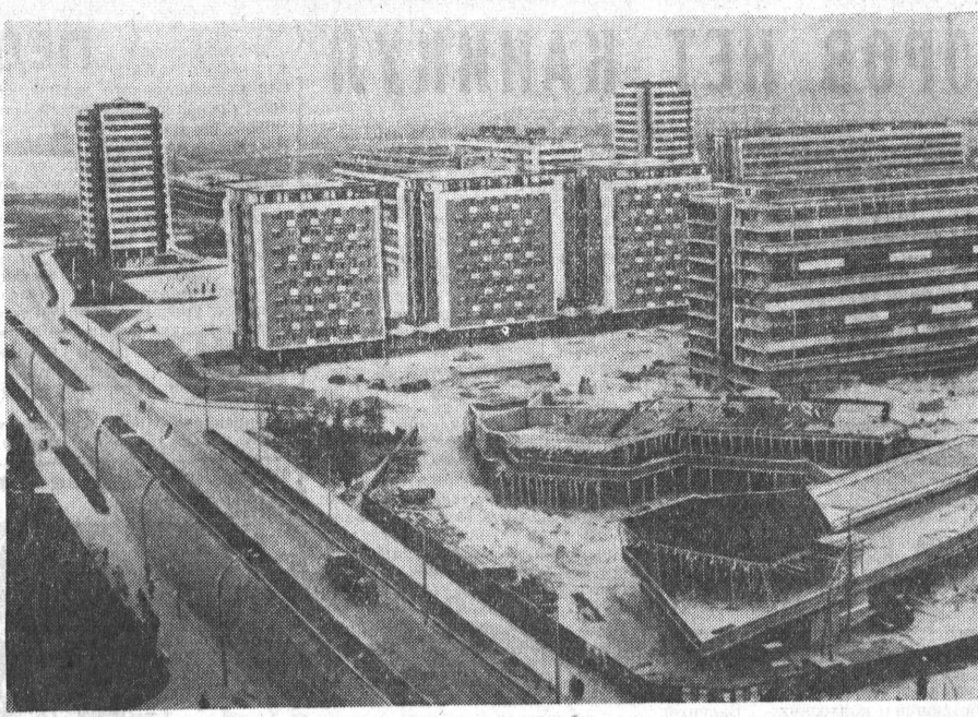
Социалистическая Федеративная Республика Югославия. Из года в год растет и хорошеет Белград. Границы югославской столицы вышли на левый берег реки Савы, где сооружается Новый Белград на 250 тысяч жителей. К 1968 году будет построена половина нового города. Намечено соорудить 25.000 квартир, 10 школ, 7 детских садов, несколько ресторанов и парков. Сейчас Новый Белград насчитывает 55.000 жителей. НА СНИМКЕ: один из кварталов Нового Белграда.