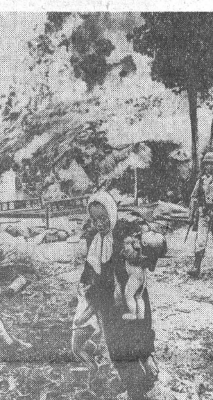
Этот снимок сделан в Южном Вьетнаме. Здесь царит провал и кровавый террор. За последние несколько лет казнено в Южном Вьетнаме 140 000 человек. При малейшем подозрении в соучастии и партизанам индонезийские каратели сигнализируют до, а крестьян — загоняют в концентрационные лагеря, которые индонезийцы называют «страшными деревнями». На снимке, сделанном в одной из деревень Южного Вьетнама, женщины с детьми покидают жилище, сожженное карателями.

ЛЕОПОЛЬДВИЛЬ, 25 сентября. Корреспондент ТАСС В. Кузнецов передает: Вооруженные парашютисты силой разогнали сегодня мирную демонстрацию конголезских патриотов, требовавших освобождения Антуана Гизени. Собравшись у здания представительства ООН в Конго, демонстранты в организованном порядке с портретами Лумумбы и Гизени направлялись к резиденции президента республики. Они выразили желание встретиться с Касабу и вручить ему петицию. Среди участников этой мирной демонстрации находились видные политические деятели страны, парламентарии, руководители политических партий, молодежные организации, профсоюзные. В первых рядах демонстрантов — члены семьи и родственники Гизени. Однако, вывешенные в здании резиденции портреты парашютистов, подехавшие на джипах, напали на мирную демонстрацию и разогнали ее, применив слезоточивые газы. Члены семьи и родственники Гизени были посажены на грузовики и увезены в неизвестном направлении. Положение в Леопольдвиле напряженное. Правительственные здания, резиденция Касабу и здание конголезского парламента окружены войсками.