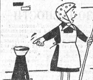
Рис. А. Завьялова.

— И чему их там только учат? Получил звание мастера спорта по стрельбе, а сюда попасть не может!