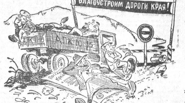
А мы повремем... Рис. А. Урюпина.

Бийском, так сразу т. Гиечко свои автомашины переключает на эту дорогу. Это прямой обман исполкома районного Совета и общественности. На территории своего совхоза т. Гиечко также не ремонтирует дороги, ссылаясь на занятость хозяйственными делами. Спрашивается, кто же для совхоза будет готовить дороги?