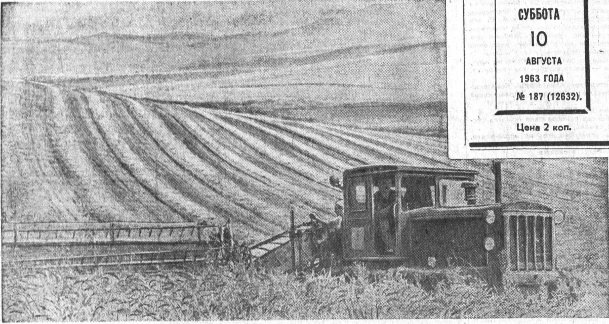
За 8-9 дней провести косовицу и за десять дней подобрать валки решили хлеборобы совхоза «Советская Сибирь» Алтайского района. На снимке: жатва в совхозе «Советская Сибирь».

Орган Алтайских промышленного и сельского крайкомов КПСС, промышленного и сельского краевых Советов депутатов трудящихся.