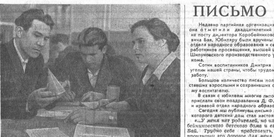
Горячая экзаменационная пора наступила для учащихся Алтайской заочной краевой средней школы.

Комсомольская организация электротеха котельного завода насчитывает шестнадцать членов.