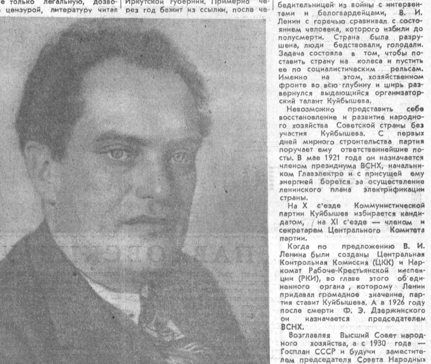
Куйбышев В. В. — выдающийся деятель Коммунистической партии и Советского государства (1888—1935 гг.).