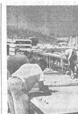
Республика Куба. На западе от Гаваны в провинции Пинар-дель-Рио сооружается самая крупная в республике Маринская тепловая электростанция.

КАИР, 18 апреля. (ТАСС). Вчера утром в Каире состоялись демонстрации в связи с подписанием декларации о трехстороннем единстве — ОАР, САР и Иракской Республики.