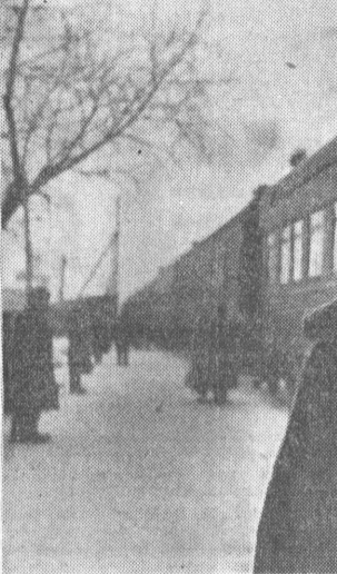
ОБЛАДАТЕЛЬНИЦА ВЫМПЕЛА. Кто бывал на станции Большая Речка...