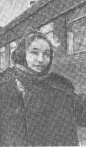
ОБЛАДАТЕЛЬНИЦА ВЫМПЕЛА. Кто бывал на станции Большая Речка...