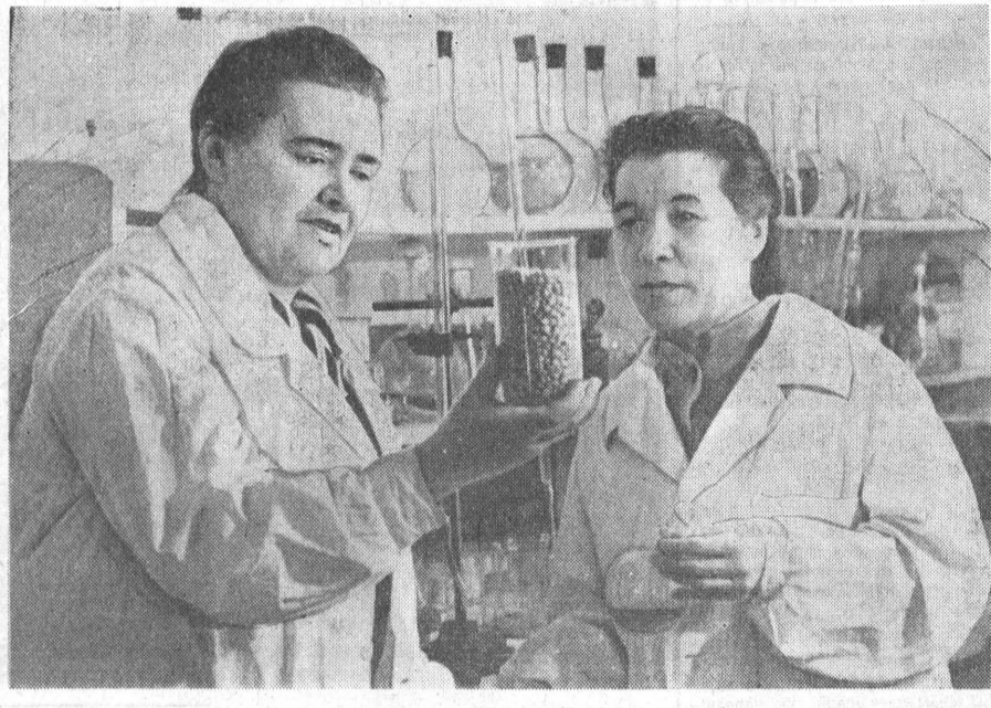
Отдел селекции Алтайского научно-исследовательского института сельского хозяйства работает над выведением скороспелых районированных сортов кукурузы. Стебли этих сортов низкие и тонкие. Это позволяет убирать кукурузу как раздельно так и целиком.

Первая краевая межсоюзная (сельская) конференция завершает перестройку в профсоюзных организациях. Теперь дело за тем, чтобы все руководящие профсоюзные органы решительно повернулись к колхозам и совхозам, были значительно ближе, чем раньше, к жизни, к человеку труда — строителю коммунизма.