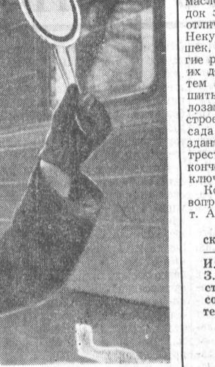
ОБЛАДАТЕЛЬНИЦА ВЫМПЕЛА. Кто бывал на станции Большая Речка...