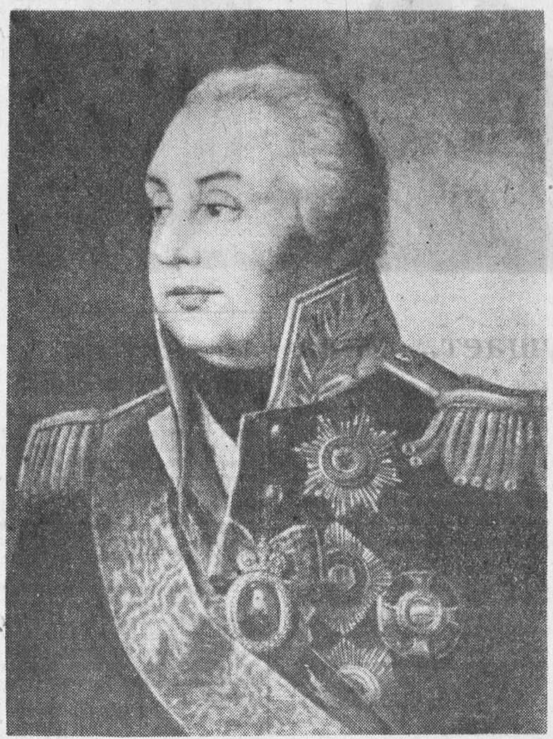
Кутузов Михаил Илларионович — гениальный русский полководец, один из создателей передового русского военного искусства.

Трудящиеся Алтай широко отмечают 150-летие Отечественной войны 1812 года — незабываемой вехи в истории русского народа. В городах и селах сгоят память героев великой эпопеи. Все, что связано с событиями тех далеких лет — произведения литературы и живописи, исторические документы, — вызывает у людей горячий интерес.