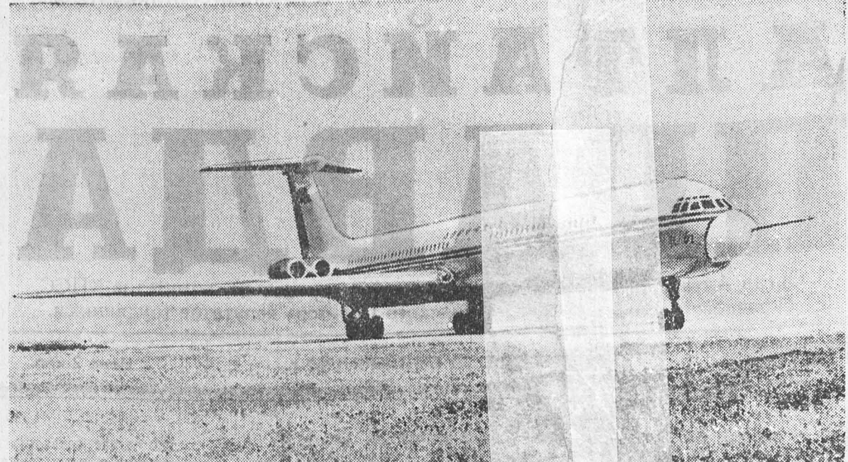
Новый пассажирский самолет «Ил-62», созданный коллективом конструкторов, дважды Героев Социалистического Труда...