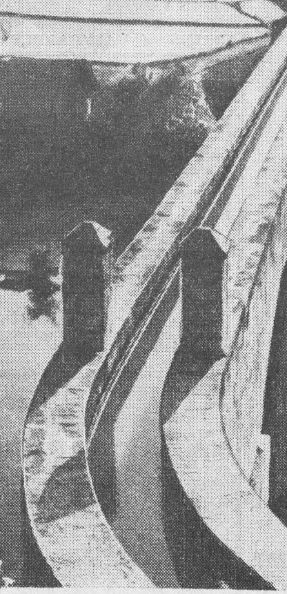
На снимке: один из акведуков Ляньцзяньской ирригационной системы.

НЬЮ-ЙОРК, 28 сентября. (ТАСС). Генеральная Ассамблея ООН на дневном пленарном заседании 27 сентября утвердила рекомендации Генерального Комитета включить в повестку дня ее XVII сессии предложенные делегацией СССР вопросы: «Об осуждении пропаганды превентивной ядерной войны» и «Экономическая программа разоружения». В общей дискуссии на заседании выступили представители Чили, Турции, Цейлона и Таиланда.