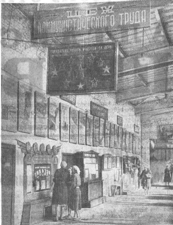
На предприятии коммунистического труда. Карбюраторный цех Алтайского завода тракторного электрооборудования.

Большевики Бийска проделали огромную работу по социалистическому переустройству нашего города.