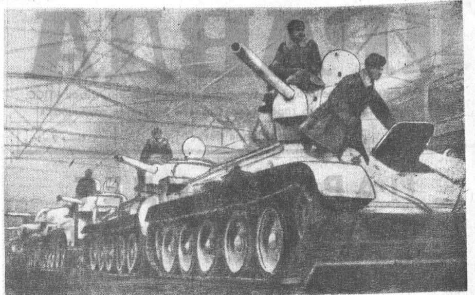
В цехе завода на Урале. Танки готовы к отправке на фронт.

На этой странице участники Великой Отечественной войны, слабые труженики тыла рассказывают о героизме и мужестве советских людей, о том, как ковалась победа над гитлеровской Германией.