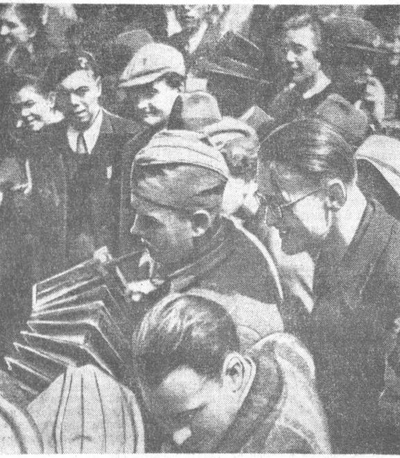
Радостно встречали своих освободителей граждане Чехословакии. Советских солдат забрасывали цветами, цвелокали, приглашали в гости. Чехословацкий гражданин Вацлав Модеста 9 мая 1945 года сфотографировал советские танки на улице Праги, сердечно встречая и приветствуя, слушающих игру советского солдата-баяниста. Эти снимки, показывающие завершение войны, сегодня стали историческими документами. Первая советская песня на улице Праги.

В. ДОННИН, артиллерийского дивизиона, г. Москва.