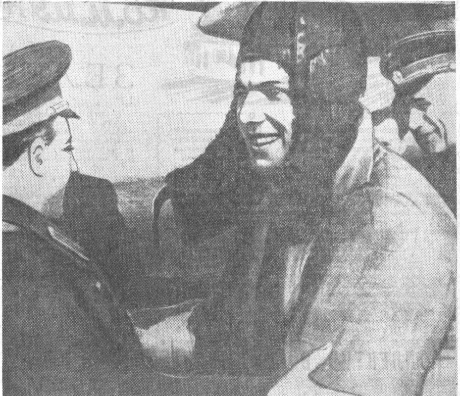
Друзья-авиаторы поздравляют Юрия Алексеевича Гагарина вскоре после успешного приземления космического корабля «Восток».