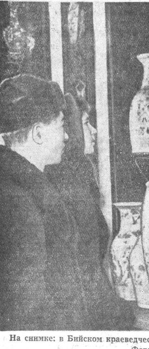
На снимке: в Бийском краеведческом музее.