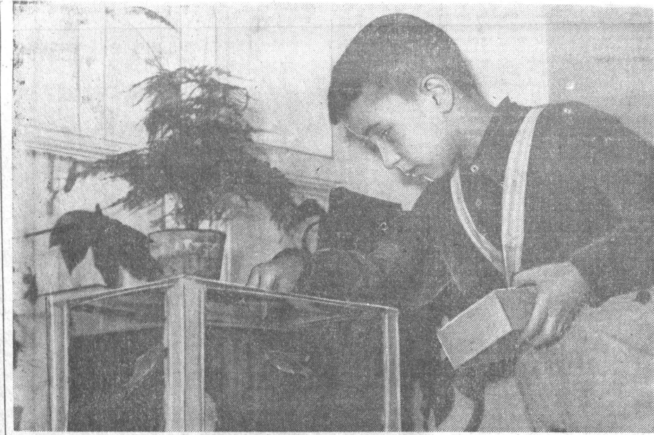
Юный любитель природы.