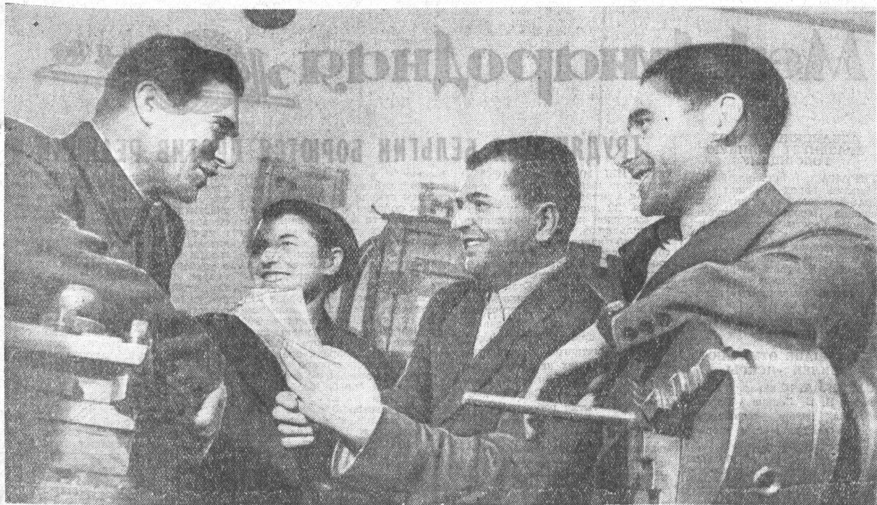
Соревнуясь в честь очередного Пленума ЦК КПСС, коллектив механизаторов Табунского совхоза Табунского района еще в начале декабря выполнил план ремонта тракторов и комбайнов, намеченный на четвертый квартал 1960 года. Не снимают темпов ремонта сельхозмашинок табуны и в новом году. Отремонтированы свыше десяти тракторов.

Большую помощь ремонтникам оказывают совхозные рационализаторы. Недавно они сконструировали и изготовили приспособление для запуска дизелей в зимнее время.