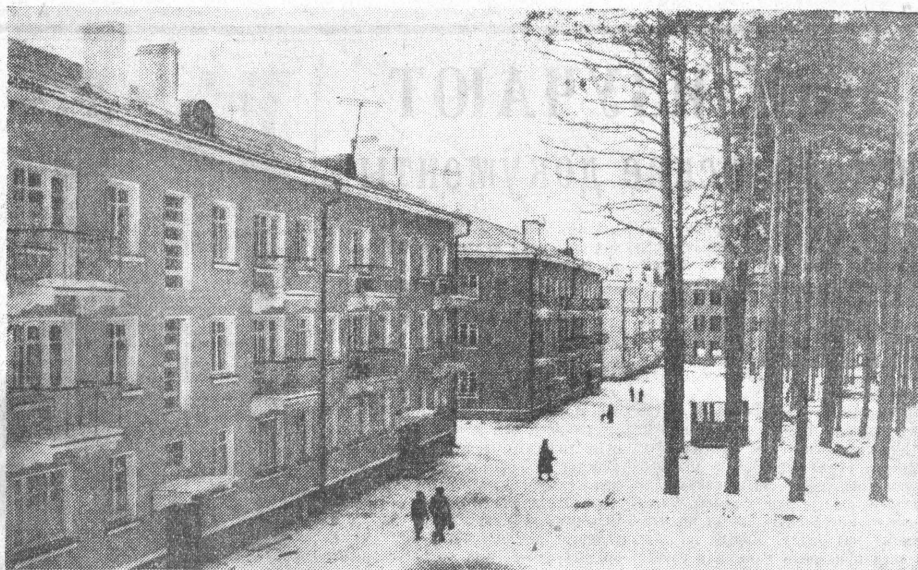
НА СТРОИТЕЛЬСТВЕ БЕЛОЯРСКОЙ АЭС

Работа зерноочистительных машин, просушки семян повышенной влажности должна быть уделено главное внимание агрономов и руководителей хозяйств, райкомов КПСС и райисполкомов.