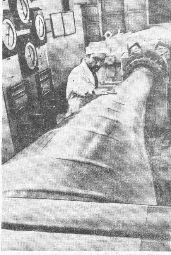
В Ереване строится крупный завод «Поливинилцелат» для производства искусственного волокна. Здесь уже действует опытные установки искусственного волокна, цех плетения «бутафоль» (искусственный материал, применяемый для изготовления безополочного стекла и пленки) и другие.