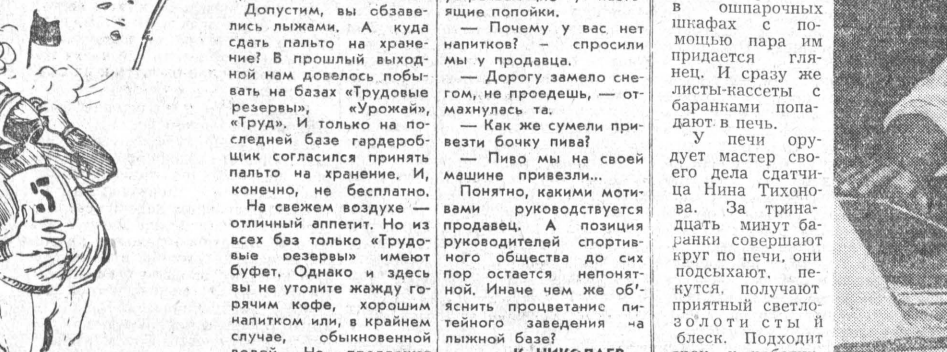
ШУМЕЛ КАМЫШ НА ЛЫЖНОЙ БАЗЕ

Сосновый бор, чистый морозный воздух, прекрасная лыжня — о чем еще может мечтать городской житель, решивший в выходной день выйти на лыжную прогулку? Сколько таких прекрасных мест в окрестностях Барнаула!