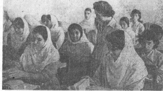
В Афганистане в последние годы женщины привлекаются к участию в государственной, политической и общественной жизни. В стране все больше открывается женских школ. На снимке: на уроке в одной из женских школ столицы.

НЬЮ-ЙОРК, 16 декабря. (ТАСС). Вечером 15 декабря Политический Комитет закончил обсуждение алжирского вопроса и большинством голосов принял резолюцию 24 стран Азии и Африки. Ее поддержало 47 делегаций: 20 государств, в том числе все колониальные страны во главе с Соединенными Штатами, голосовали против, 28 воздержались и четыре делегации, среди них французская, в голосовании не участвовали. Эта резолюция, в частности, постановляет, чтобы в Алжире под контролем и надзором ООН был проведен референдум, в котором алжирский народ мог бы свободно определить судьбу своей страны.