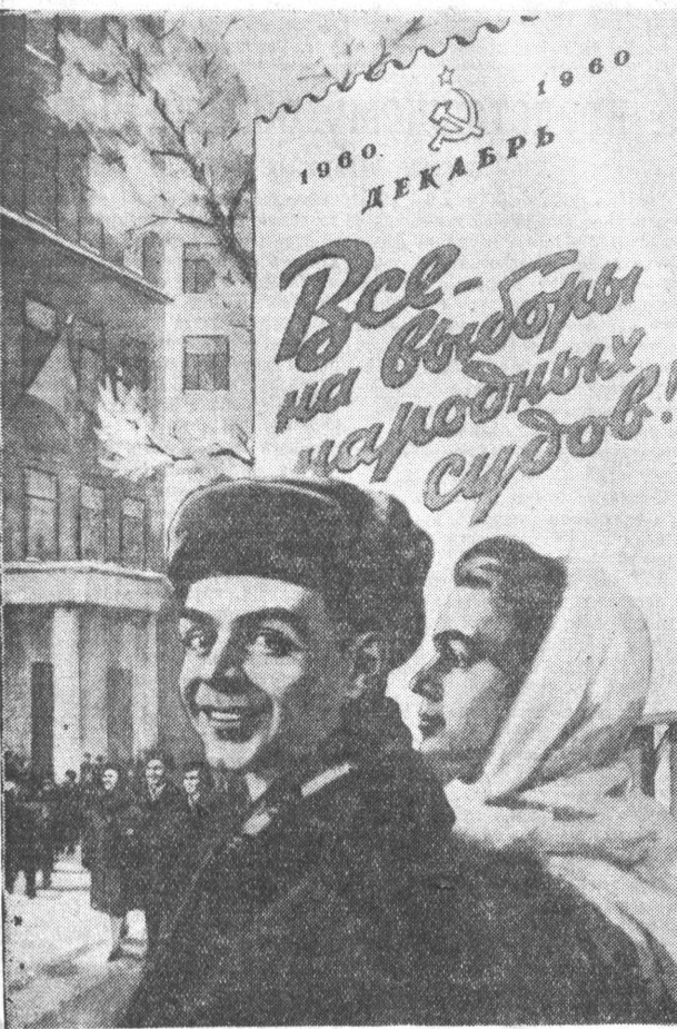
Плакат худ. А. Лаврова.

В. БЕЗНОСЕНКО. г. Барнаул, завод мехпрессов.