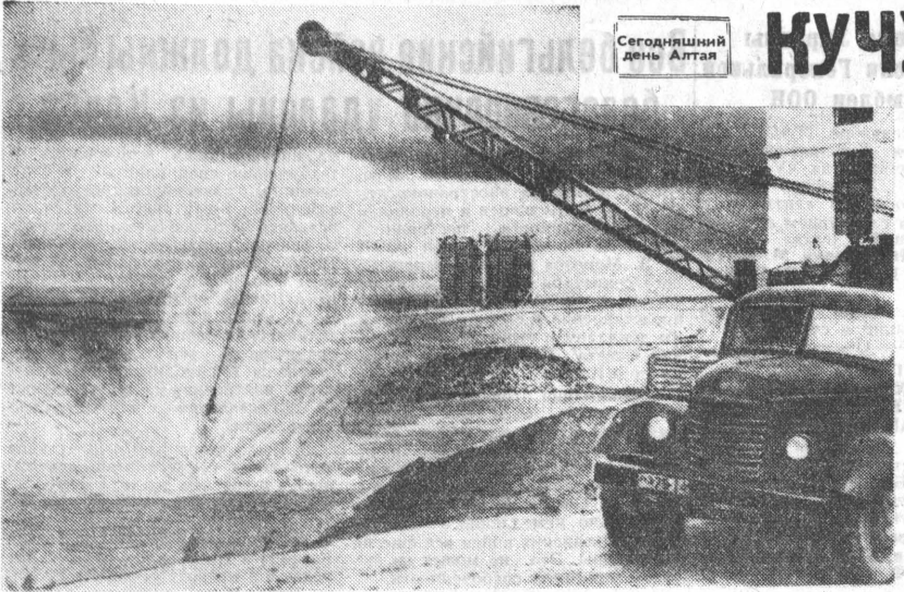
Сегодняшний день Алтая