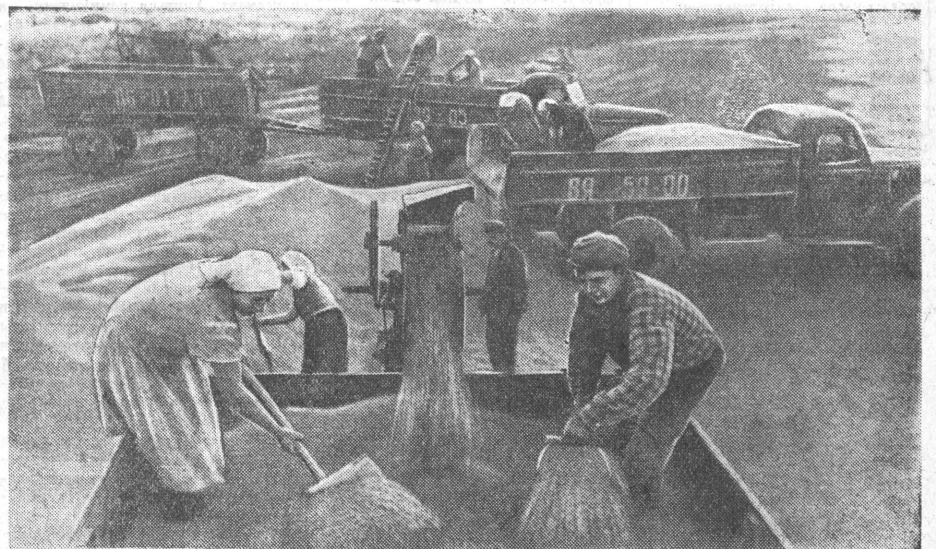
И. УРАЛОВ.