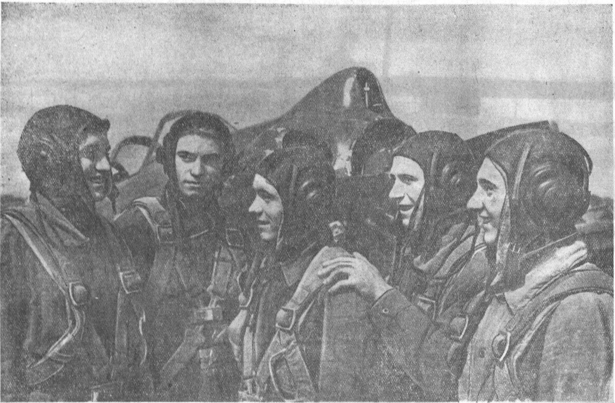
Популярен авиационный спорт среди молодежи края. Люди разных профессий занимаются им в Барнаульском аэроклубе. Они успешно овладевают самолетом.

Народы нашей страны в нынешнем году отмечают праздники Воздушного Флота в обстановке огромного трудового и политического подъема в борьбе за превращение в жизнь исторических решений XXI съезда Коммунистической партии.