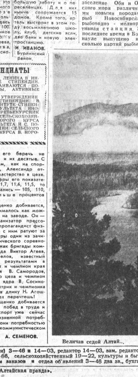
Величав седой Алтай..