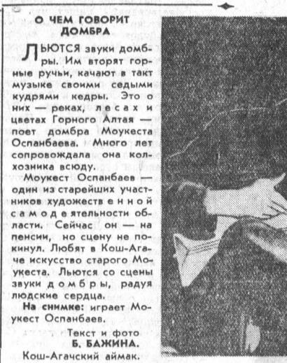
Текст и фото Б. БАЖИНА. Кош-Агачский аймак.