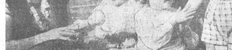
Текст и фото М. БОГОМЯКОВА. г. Барнаул.