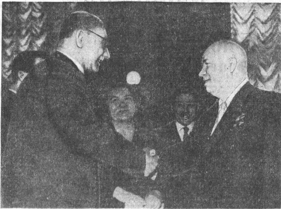
ПРЕБЫВАНИЕ ПРЕДСЕДАТЕЛЯ СОВЕТА МИНИСТРОВ СССР Н. С. ХРУЩЕВА В АВСТРИИ Н. С. Хрущев обменивается рукопожатием с бургомистром Вены Францем Ионасом во время посещения ратуши.