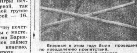
Фотоземель М. Богомазова.