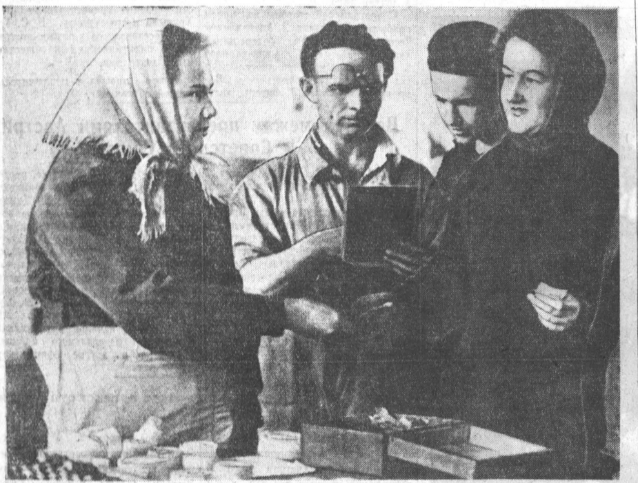
Коллектив вагонного депо станции Барнаул упорно борется за высокую культуру труда. А как лучше организовать питание рабочих? Над этим задумались и работники столовой, они решили принимать заказы на обед от рабочих прямо в цехах.

В зале не было равнодушных слушателей. Выступлению говорили страстно, с волнением. Их выступления вызвали живой отклик у присутствующих, пробуждали потребность высказаться, поделиться своими мыслями, сомнениями, поспорить.