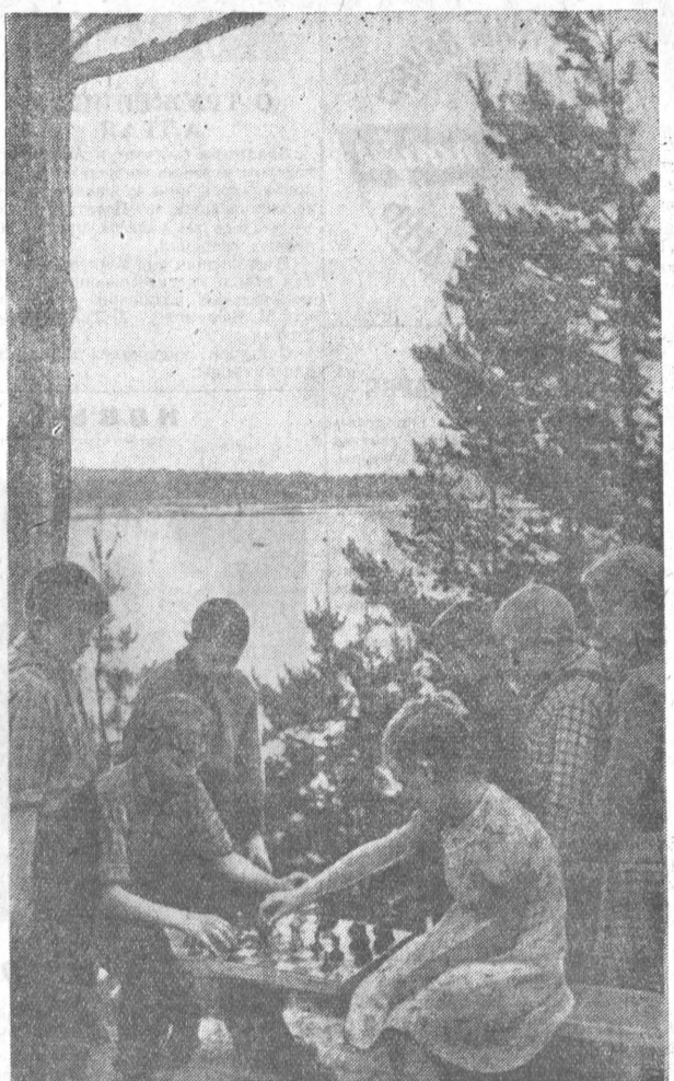
Более двухсот детей работников советской торговли отдыхают в пионерском лагере, расположенном в сосновом бору около Павловска. На снимке: в одной из уголков лагеря.