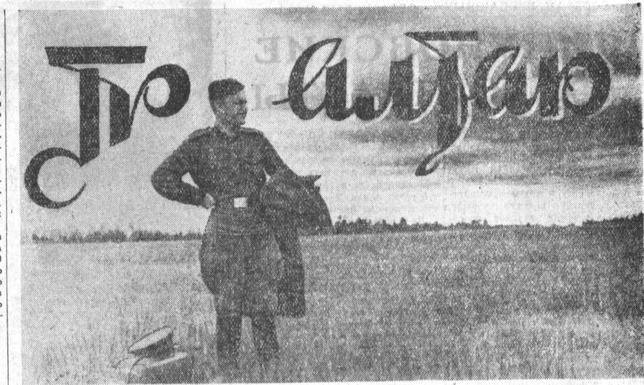
Здравствуй, мирный труд!

Упрощается билетная система. Старый порядок обязывал кондуктора выдавать пассажиру на несколько остановок осязаемый билет (он позволял учесть количество пассажиров, перевезенных за день) и два дополнительных. За смену расходовалось более 4 тысяч таких билетов, что усложняло труд кондуктора. Теперь на маршрут будет выдаваться один билет.