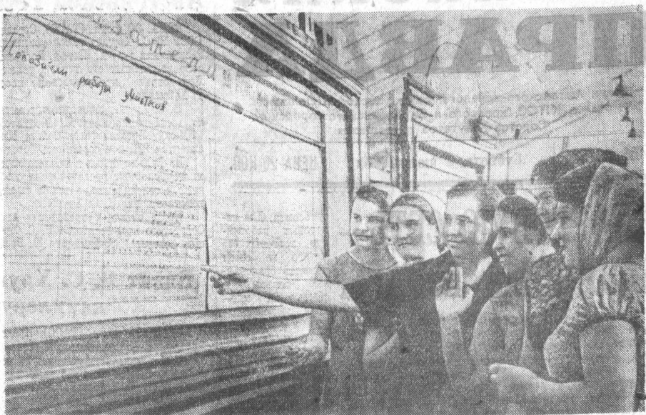
А кто же идет впереди? На снимке вы видите группу девушек у доски показателей...