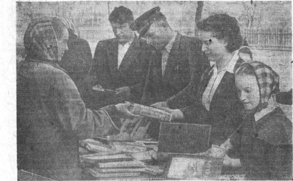
СПРОС НА КНИГИ РАСТЕТ