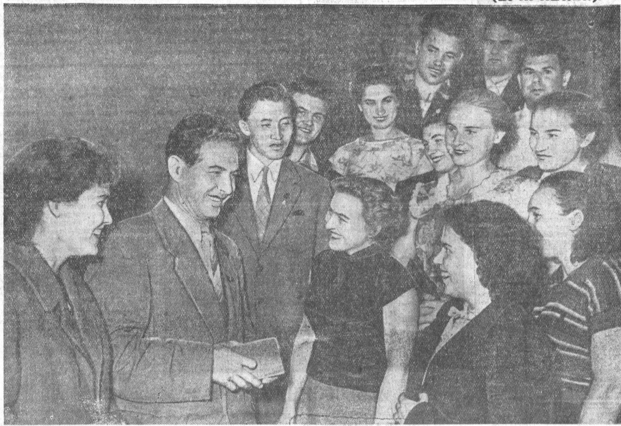
Много новых мыслей вызвало совещание. В перерывах молодежь оживленно общалась и беседовала. На снимке: представители Бийска.