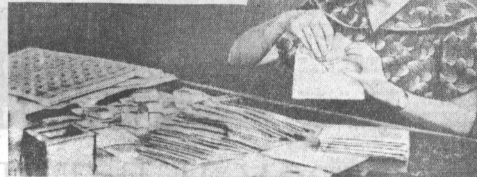
Из истории нашего края

Прошел дождь. И как всегда после него побегали веселые ручьи. Но на этот раз они были необыкновенно по своему цвету — вода в них была бледно-зеленой.