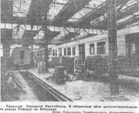
Польская Народная Республика. В сборочном цехе вагоностроительного завода Папажа во Вроцлаве.

НЬЮ-ЙОРК. 17 июня. (ТАСС). «Неожиданно для президента не ожидалось крушение слона воздуха в Токио создало среду озабоченных его лиц атмосфере мрачного уныния».