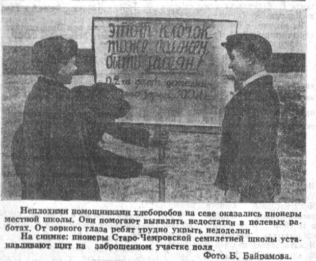
Неплохими помощниками хлеборобов на сева оказались пионеры местной школы. Они помогают выявлять недостатки в полевых работах. От зоркого глаза ребят трудно укрыть недолетки. На снимке: пионеры Старо-Черемшовой семилетней школы устанавливают шит на заброшенном участке поля.