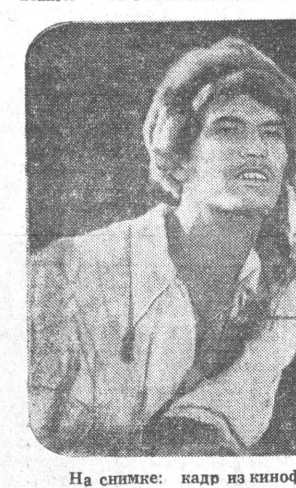
На снимке: кадры из кинофильма «Журавлиная песня».

Этот фильм-балет показывается в клубе меланжевого комбината. Он поставлен Свердловской киностудией по балетной народной легенде. «Черные охотники Арслан-бай преследуют стаю журавлей. Пастух Юмагул со своей возлюбленной Зайтангул помогают журавлям слетаться. Арслан-бай, вторые увидевший Зайтангул, решает сделать ее своей четвертой женой. Схватка между Юмагулом и Арслан-баем превращает ставящихся в оазис — аксакалы. Они предлагают доказать свою силу и право на любовь девушки в честном поединке. Арслан-бай соглашается, но перед самым началом поединка закрывает Юмагула в пещере. Тогда на помощь мужественному юноше приходит сама природа: вода превращает Зайтангула в пещеру. В силе и ловкости он превзошел Арслан-бая. Тот признал себя побежденным. Но стрела кованого Арслан-бая смертельно ранила Зайтангул. Юмагул отомстил за свою возлюбленную — он убил Арслан-бая».