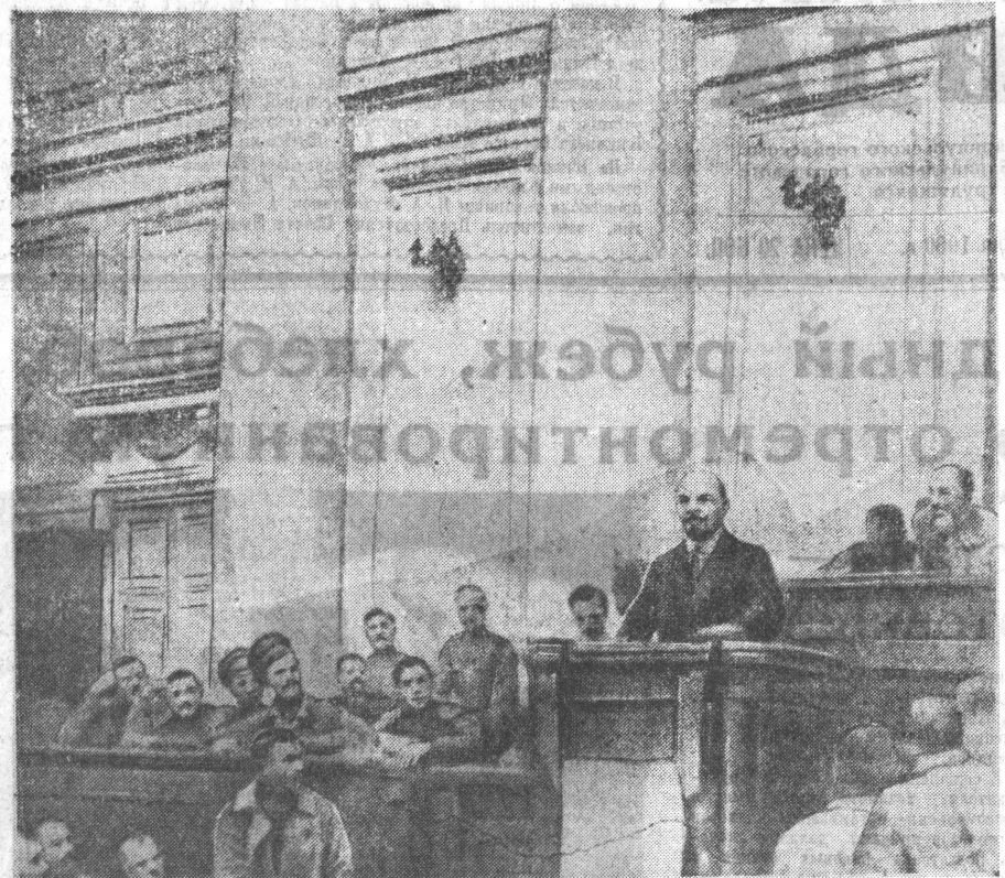
Перед нами уникальная фотография: выступление В. И. Ленина 4 апреля 1917 года в Таврическом дворце. Где он отдал свои знаменитые Апрельские тезисы.