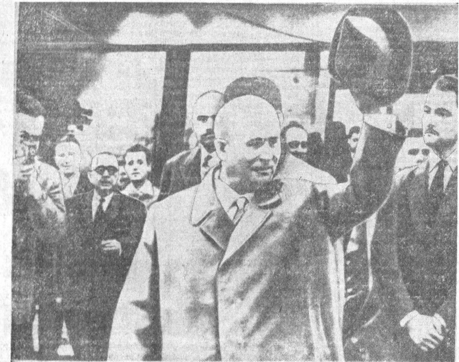
Н. С. Хрущев во Франции. Глава Советского правительства посетил район нефтяных и газовых месторождений Лак. На снимке: Н. С. Хрущев отвечает на приветствия. (Снимок принят по фототелеграфу).

Телезрители увидели также визит Н. С. Хрущева президенту Франции, возложение венков на могилу Неизвестного солдата и у форта Мон-Валерен, где во время оккупации гитлеровцы расстреливали героев Сопротивления.