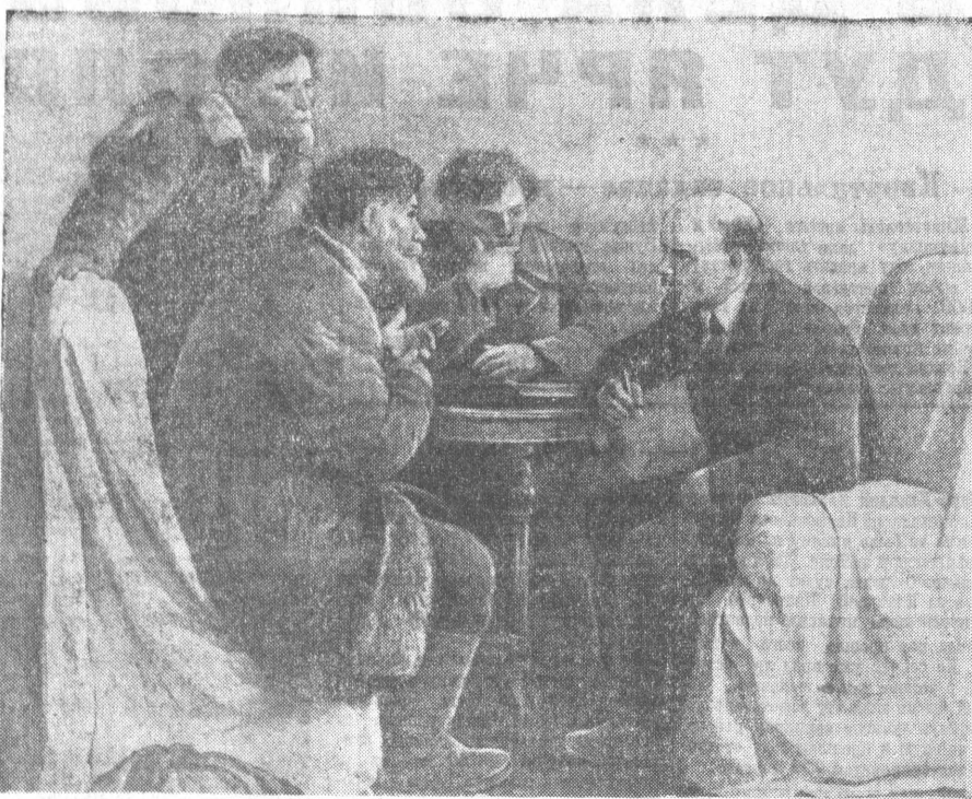
Ходоки у В. И. Ленина.