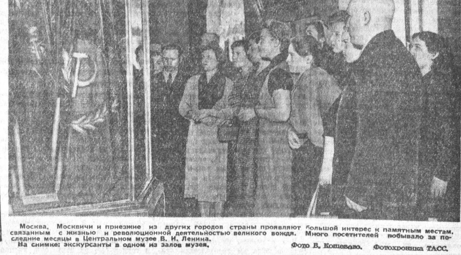
Москва, Москвичи и приезжие из других городов страны проявляют большой интерес к памятным местам, связанным с жизнью и революционной деятельностью великого вождя. Много посетителей было во время открытия музея В. И. Ленина. На снимке: экскурсанты в одном из залов музея.

Очень важно, чтобы на предприятиях использовали освободившиеся из-под выгрузки вагоны под погрузку. Между тем многие клиенты никак не хотят менять так называемые «своённые» операции, выгодные как для предприятий, так и для отделения в целом.