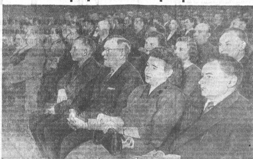
Алтайская краевая межсоюзная конференция профсоюзов. На снимке: в зале заседания конференции.