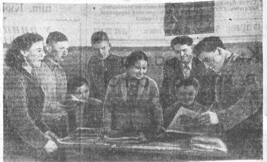
На снимке: активные рабселькоры михайловской районной газеты «Под знаменем Ленина».