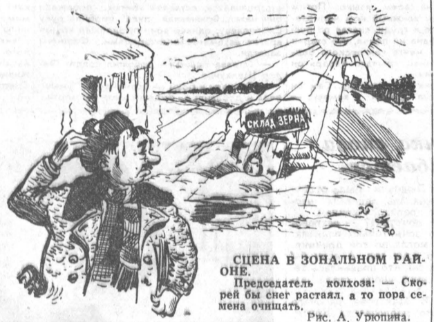
СЦЕНА В ЗОНАЛЬНОМ РАЙОНЕ. Председатель колхоза: — Скоре бы снег растаял, а то пора семена очищать.