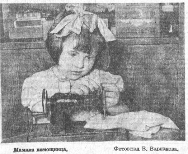
Машина помощница.

В селе Ключи детский сад расположен в большом светлом доме. Хорошо и интересно здесь нашим детям. Только одно плохо: нет группы круглосуточного пребывания.