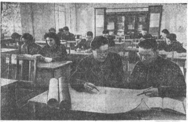
На снимке: в читальном зале Алтайского политехнического института.