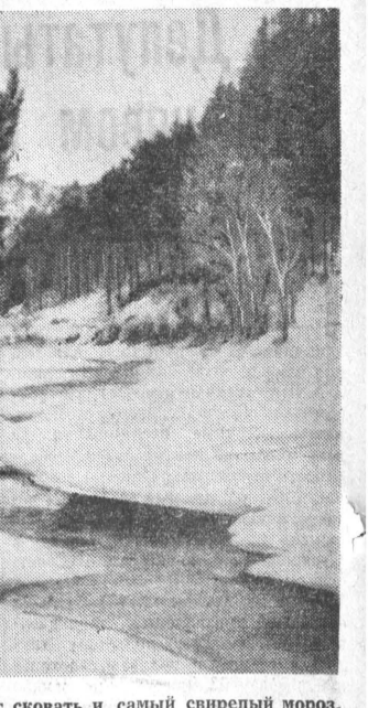
Текст и фото И. ТАМОЖНИКОВА.

Текст и фото В. ШЕВЧИКА, нашего ленинградского корреспондента.