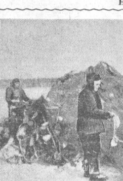
Текст и фото А. ФРОЛОВА. Романовский район.

Зимой на берегах водопада зимует интересная птица — оляпка. Быстро ныряет она в воду в поисках корма.