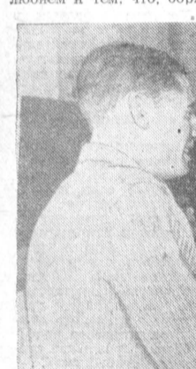
Текст и фото Б. БУТОРИНА. г. Барнаул.

ударника коммунистического труда, выполняет нормы на 180—200 процентов. Страстный спортсмен, Владимир привлек многих к занятиям лыжным спортом.