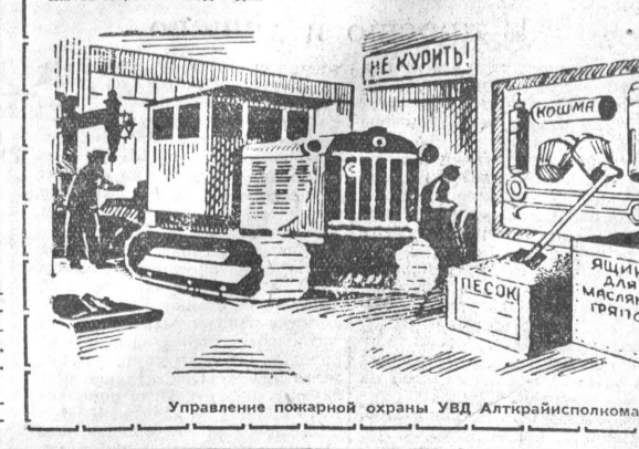
Управление пожарной охраны УВД Алтайрайспоконма.