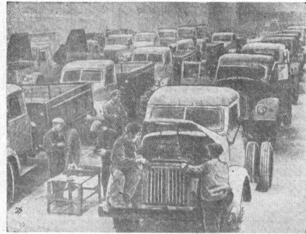
Корейская Народно-Демократическая Республика. На Дечкенском автообъединительном заводе (провинция Южная Хенан) налаживается производство грузовых автомашин. На снимке: в цехе сборки Дечкенского автозавода.

Газета «Индонезиан обсервер» подчеркивает в передовой статье, что Н. С. Хрущев будет оказана сердечная встреча. Газета подчеркивает в своей статье заявление МИД Индонезии о том, что этот визит еще более укрепит узлы дружбы и сотрудничества, уже существующие между двумя нациями. Это пойдет на пользу не только Индонезии, заключает газета, но и всей Азии и всему миру.