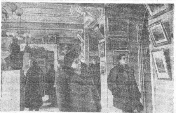
На снимке: осенняя выставка работ художников Барнаула.