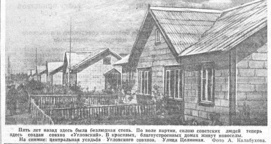
Пять лет назад здесь была безлюдная степь. По воле партии, силе советских людей теперь здесь создан совхоз «Угловский». В красивых, благоустроенных домах живут новоселы. На снимке: центральная усадьба Угловского совхоза. Улица Целинная.

Еще богатый урожай не созрел на бескрайних алтайских полях, а рабочие промышленных предприятий Барнаула уже подавали заявления с просьбой направить их на помощь сельским труженикам.