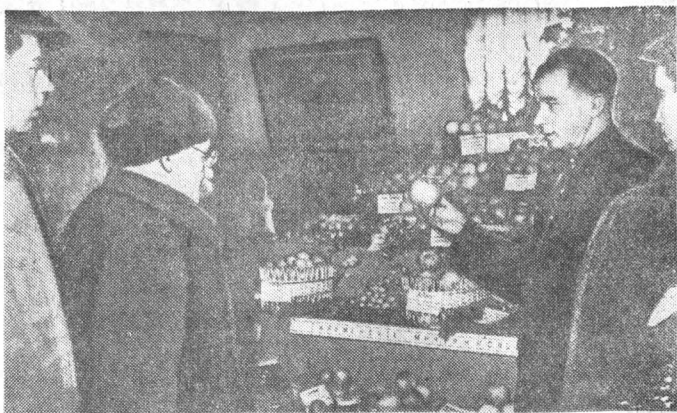
Из блокнота натуралиста