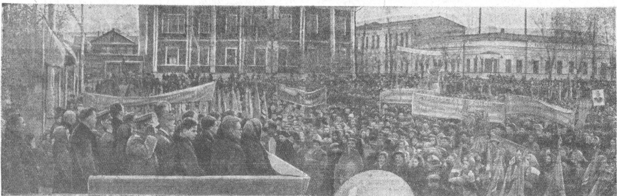
Барнаул, площадь Свободы. Молодежный митинг, посвященный празднованию сорокалетия Ленинского комсомола.

(Из Призывов ЦК КПСС к 41-й годовщине Великой Октябрьской социалистической революции).