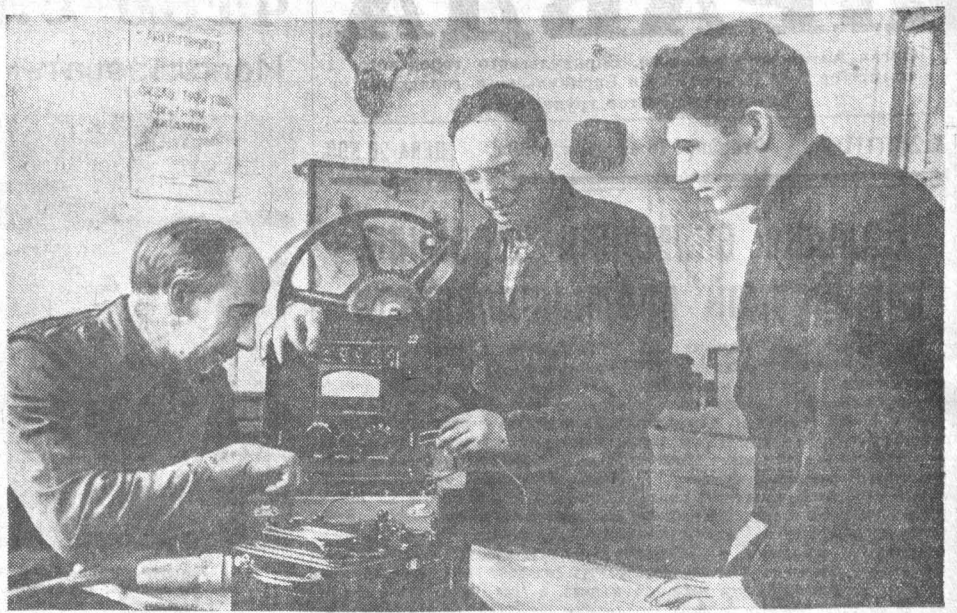
Коллектив опытно-конструкторского бюро Барнаульского завода геофизической аппаратуры сконструировал и изготовил опытный образец модернизированной полуавтоматической каротажной станции ПКС-750.