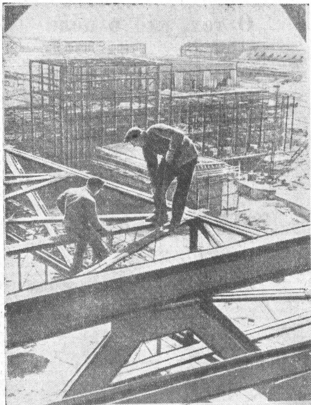
Германская Демократическая Республика. В районе Хойерверда (округ Коттбус) ведется строительство крупнейшего в республике промышленного объекта — комбината «Шварце Пушле».