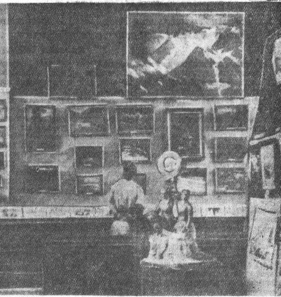
На снимке: выставка работ художников Горного Алтая.