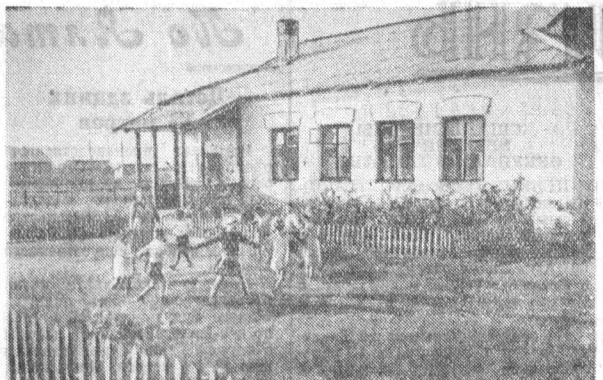
Напряженно трудятся в эти дни женщины-матери в Угловском совхозе. Они спойкают за своих детей. Для самых маленьких здесь открыты постоянные детские ясли, а недавно построен детский сад. На снимке: новый детский сад в Угловском совхозе.

Б. АВЕРЧЕНКО. (Нор. «Правды».) («Правда» от 4 сентября).