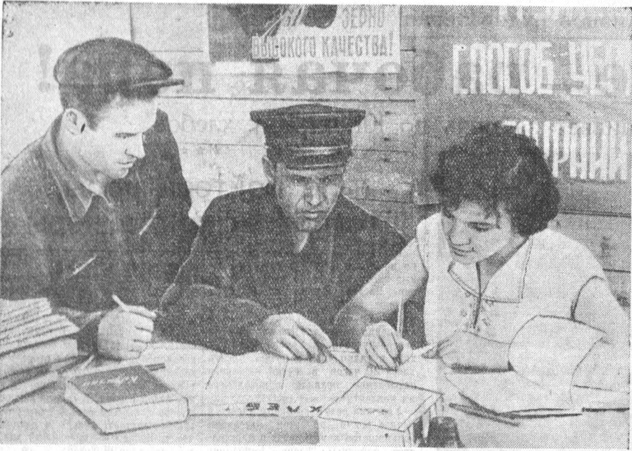
Боевым организатором на уборке является стенная газета Самборского отделения Табунского совхоза «За хлеб». Она широко пропагандирует передовой опыт, вскрывает неиспользованные резервы ускорения темпов хлебоуборки, остро критикует недостатки.

Опыт агитации и пропаганды на уборке урожая в совхозах Табунского района