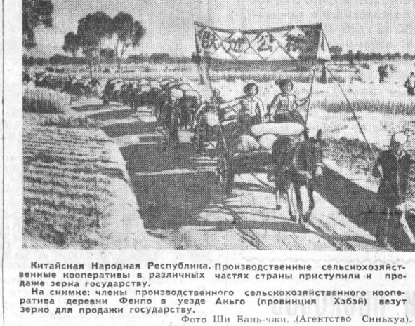
Китайская Народная Республика. Производственные сельскохозяйственные кооперативы в различных частях страны приступили к продаже зерна государству. На снимке: члены производственного сельскохозяйственного кооператива деревни Фенло в уезде Аньго (провинция Хэйбэй) везут зерно для продажи государству.